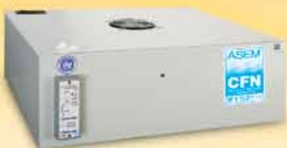
Caisson de filtration conforme à la norme NFX 15-211