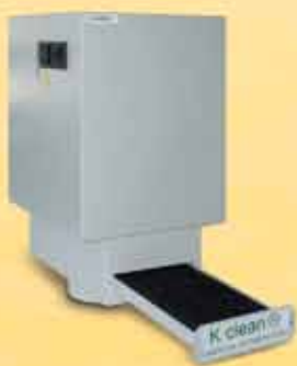
EOF100BP + K89007