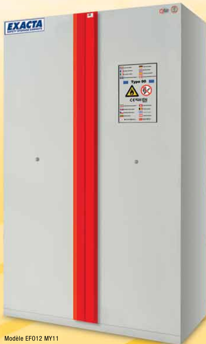
Modèle EFO12 MY11