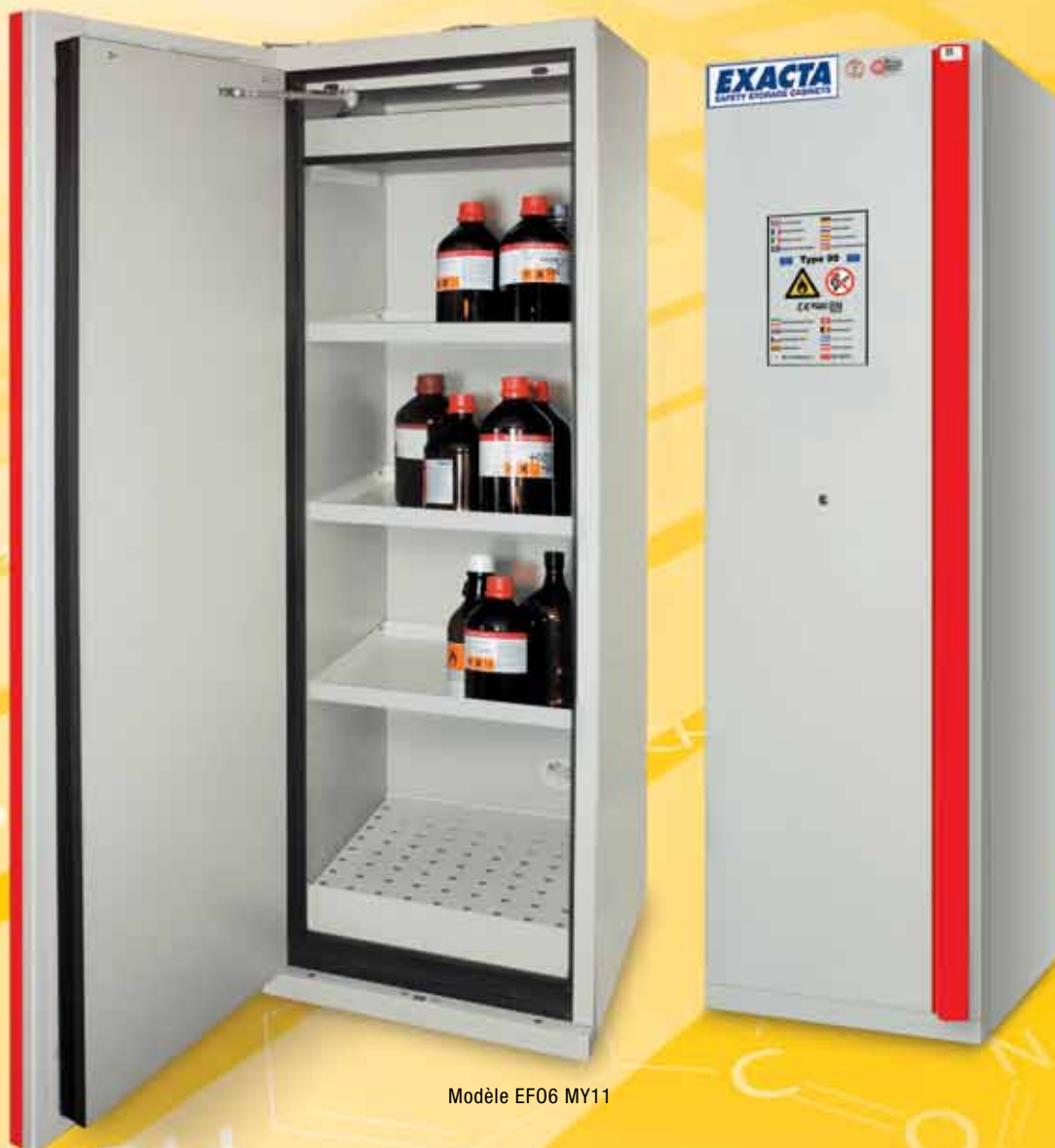
Modèle EFO6 MY11